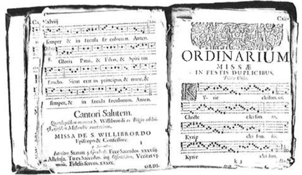
"Gradua Toegevoe gedrukt ; door Aer eeuw. In van de behoord Martinu 1842 (f