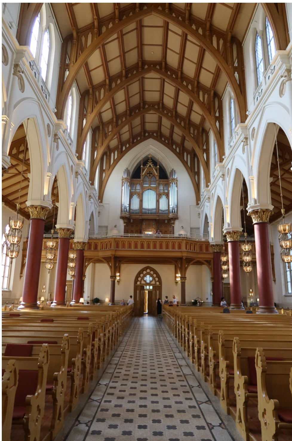
Domkerk in Göteborg.

De SGGL wenst u een mooi koorseizoen 2024-2025!